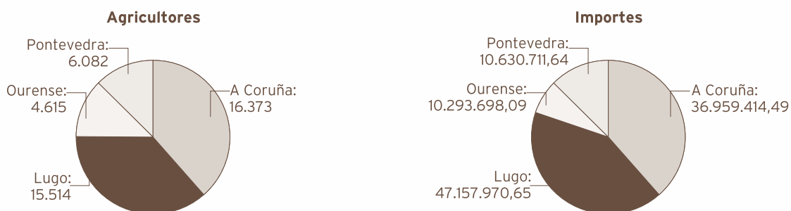
Gráfico 2.1 Dereitos de pagamento único-consolidados 2007. Distribución provincial de agricultores e importes