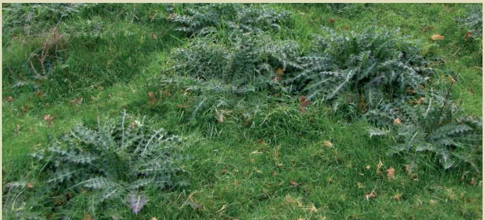
Imaxe de pradería invadida por cardo

... En terreos saturados non se empregaran vehículos, nin maquinaria, salvo que sexa para realizar tratamentos fitosanitarios, recollida de colleitas, ou subministración de alimentos ao gando.